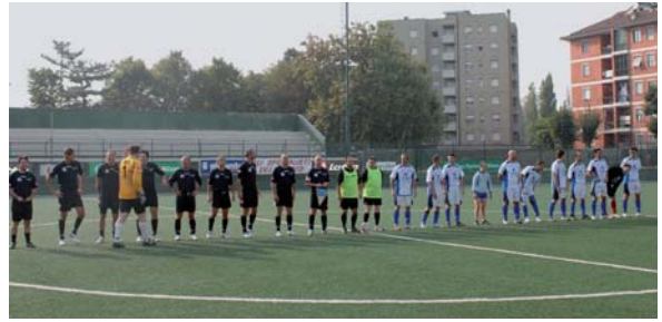
Le squadre prima del fischio di inizio

Fischio di inizio e si sa subito chi ha vinto: la solidarietà.